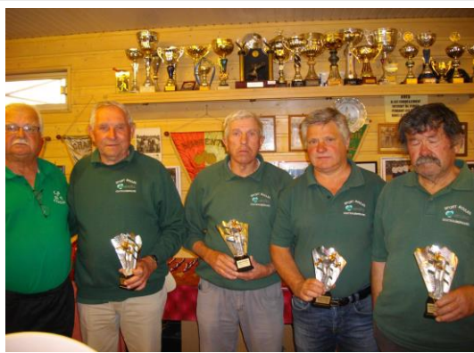
Quadrette championne 2015 ASVChâteaubernard

Pour chaque rencontre , il sera demandé une participation de